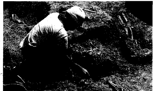
► Labores de limpieza en una de las tumbas.