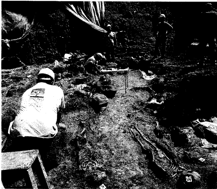
► Todos los cuerpos hallados tienen la misma posición y orientación.