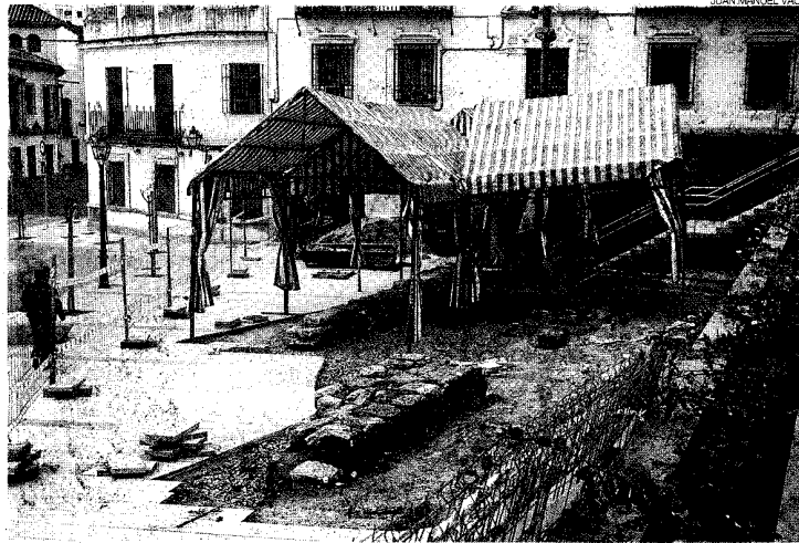
► La plaza ► Restos de la muralla y de la barbacana cubiertos con carpas.