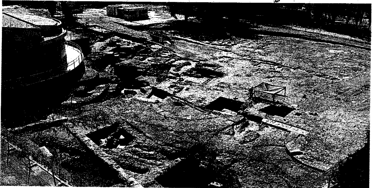
Panorámica de los restos del espacio escénico romano hallado junto a la sede central de la Universidad de Córdoba