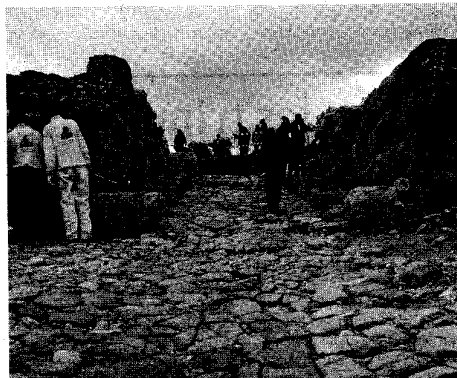
Calzada y puerta oriental del yacimiento.