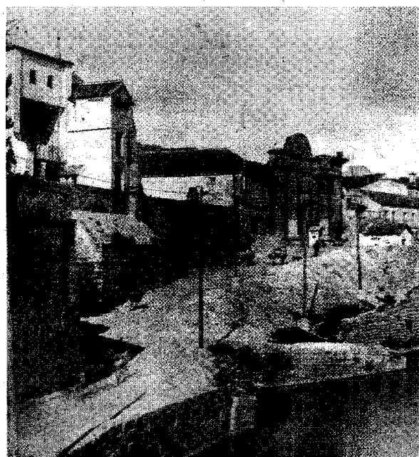
Imagen histórica de la Puerta del Puente.

No le faltaba razón al prudente ahorrador. Las tropas de Napoleón sometieron a la ciudad a un saqueo en toda regla que duró nueve días, con episodios de vio-