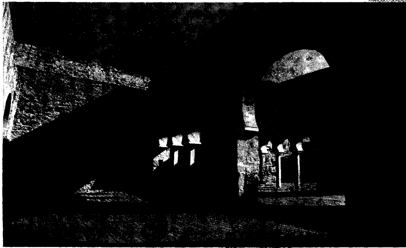
Medina Azahara aspira a ser Patrimonio Mundial, título que concede la Unesco.

El representante de Icomos y profesor de la Universidad sevillana, que ha participado estos días en Sevilla en la 33ª reunión del comité del Patrimonio Mundial de la Unesco, fue contundente al decir que "desde Icomos llevamos aconsejando que se elabore y presente el expediente sobre Medina Azahara, pues es fundamental para defenderlo, pero nunca ha habido un apoyo político". Añadió que "no he te-