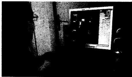
Juego virtual sobre el yacimiento.

tiene presupuestados para 2009 600.000 euros, que se invertirán en el arreglo de los accesos, y adelantó que se redactará un plan director que marque las actuaciones en Ategua que podría estar listo para mediados de año. Una de las finalidades es, sin duda, poder iniciar las visitas "lo antes posible".