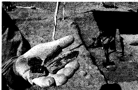
Piezas de cerámica halladas durante las excavaciones

torio al aire libre» por las posibilidades que brindará tanto a los docentes como a los jóvenes que tienen un elemento privilegiado para completar la formación teórica.