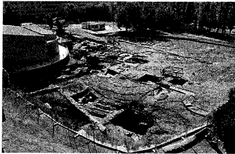
Vista general del yacimiento en toda su extensión

El análisis confirmará si tras la época romana el anfiteatro pudo haber albergado un edificio cristiano