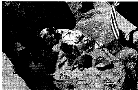
Jóvenes arqueólogos trabajan en un punto del anfiteatro

En total serán unos 40 investigadores, a los que se unirán los alumnos, trabajarán en lo que Desiderio Vaquerizo insistió en definir como «un labora-