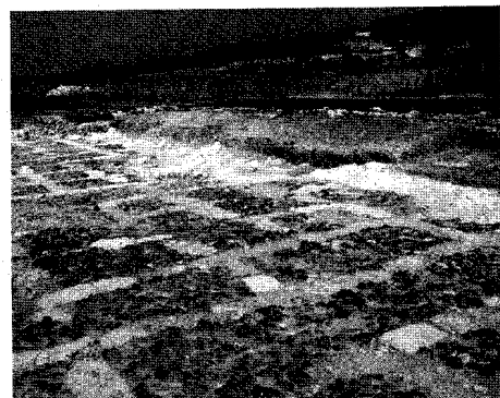
Aspecto de la calzada islámica descubierta en Medina Azahara

Con vistas al futuro, se pretende recuperar todos los elementos que se encuentran alrededor de Medina Azahara y la próxima función será su puesta en valor. La perspectivas para Medina Azahara son construir un gran complejo por el que se pueda recorrer, a partir de distintas rutas, toda la ciudad que rodeaba al palacio. No existe un plazo límite para concluir esta iniciativa ya que se trata de un proyecto de gran envergadura que se prolongaría a lo largo de los años. «Medina Azahara será una fusión de paisaje, patrimonio y cultura», afirmó la delegada.