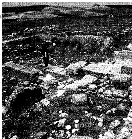
El yacimiento de Ategua.

Se prevé también la construcción de un centro de interpretación en el propio enclave para explicar y desglosar los puntos más importantes del terreno de forma complementaria a la visita.