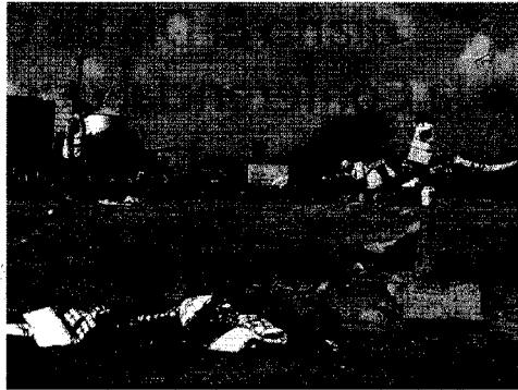
Trabajos en la excavación de la Variante de Palma del Río

El arqueólogo no se atreve a apuntar una fecha de finalización de los trabajos, ya que "sólo llevamos excavada una tercera parte de la superficie total del yacimiento y todo apunta a que queda todavía una tarea larga". Actualmente, en la zona trabajan tres operarios aunque el director de la excavación afirma que le han asegurado que próximamente se incorporarán más personas, "algo que es necesario porque hay muchos cuerpos enterrados".