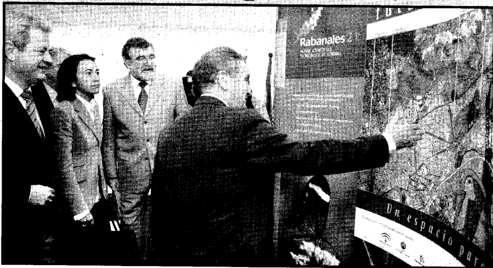
Sobre estas líneas, imagen del acto de colocación de la primera piedra. En la página anterior, estado actual de las obras del Parque. En la página siguiente, otro detalle de la colocación de la primera piedra.