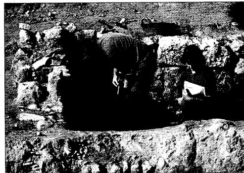
► Arqueólogos en pleno trabajo de excavación de restos.

Los restos de una mezquita en la zona de la Axerquía tienen un carácter de templo menor o de barrio. El arrabal oriental se amuralla en 1125 por parte de los Almorávides, cuyo sultán, Ali Ibn Yusuf crea un impuesto especial para las murallas de las principales ciudades de Al-Andalus como la de Sevilla y Axerquía