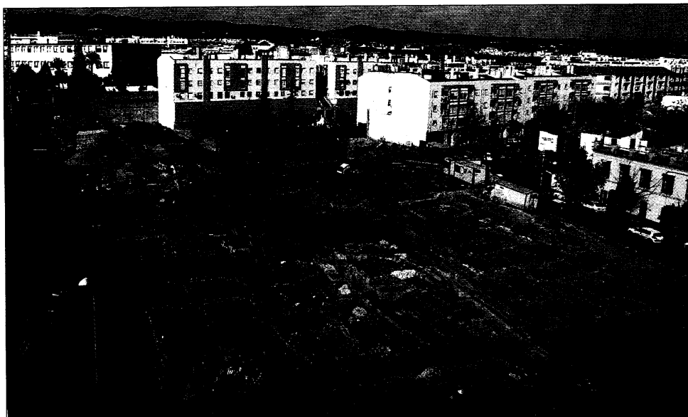
► Vista general del yacimiento arqueológico de la avenida de Ollerías.

La necrópolis romana hallada hace unas semanas conecta perfectamente con la encontrada en Ollerías 14, donde aparecieron