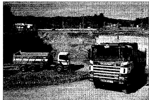
Todo está preparado para empezar a horadar el túnel.