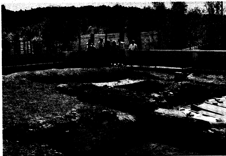
YACIMIENTO. Los accesos a los restos de la villa romana están prácticamente acabados.

Los técnicos municipales están a punto de acabar las obras de la cubierta, los accesos y las pasarelas por las que pasearán los turistas