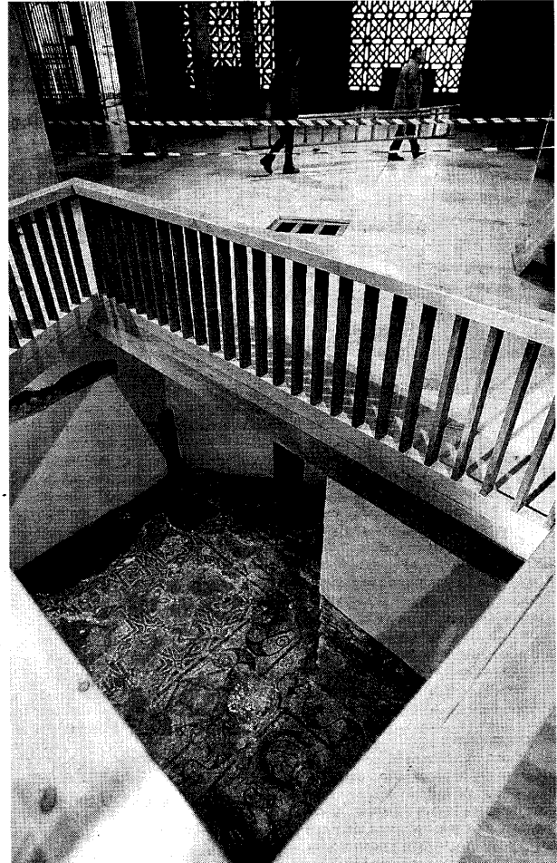
El mosaico de la basílica de San Vicente podrá contemplarse en la Mezquita-Catedral a través de una estructura de metacrilato

El arquitecto que levantó el templo recuperó la esencia de las iglesias del siglo IV, del tiempo del obispo Osio