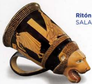
Ritón SALA 3