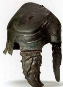
Casco SALA 6